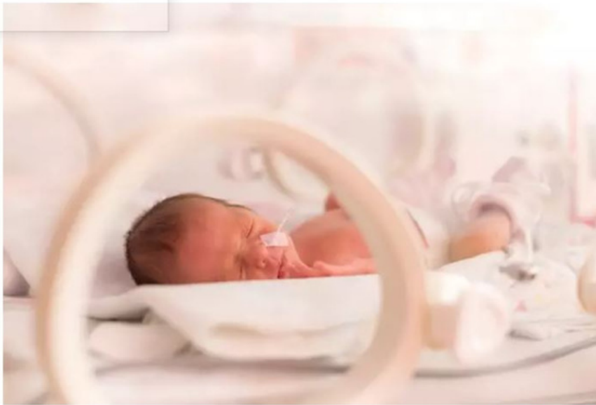
Archivo - Bebé prematuro.